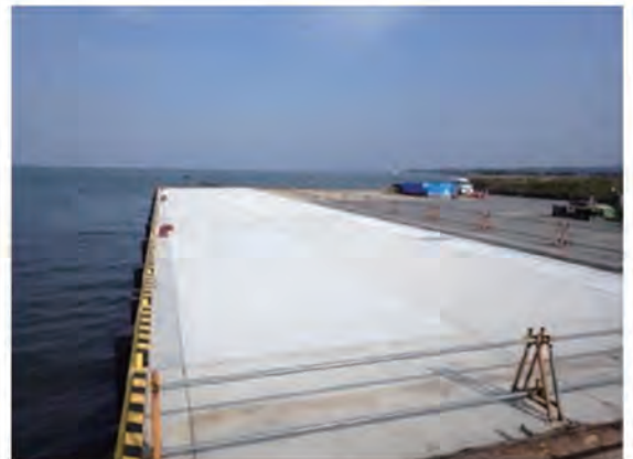
PCa 棧橋 施工後