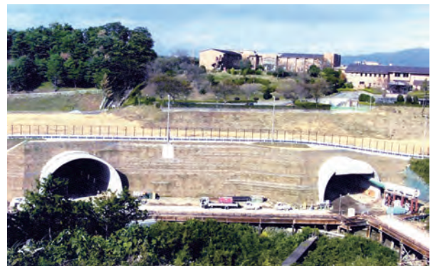
道路トンネル(開削トンネル)