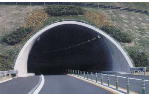
道路トンネル(坑門工)