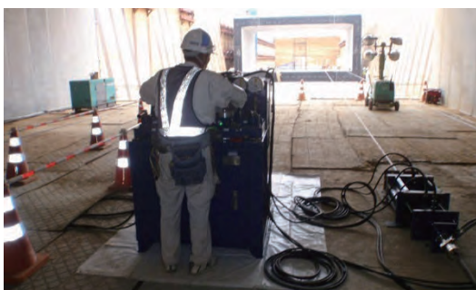
油圧ジャッキ (連続稼動) による横引き工法