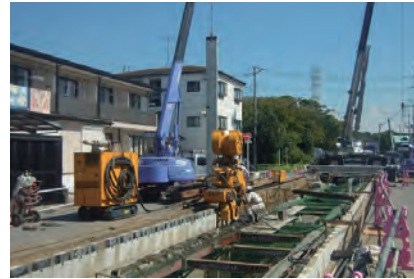
油圧圧入工法（サイレントパイラー）