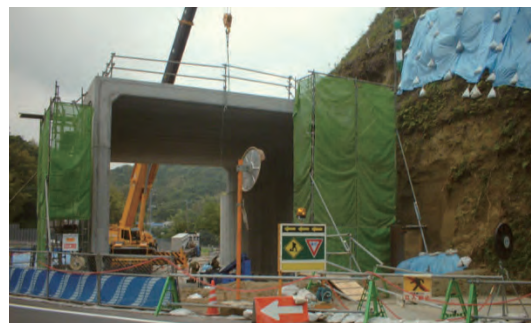
大型プレキャストボックスカルバート