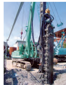
ミニウォール工法