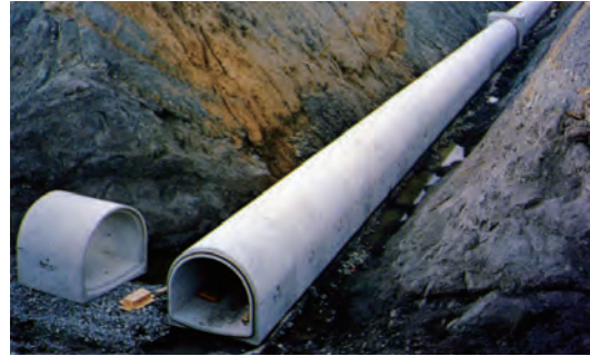
アーチカルバート