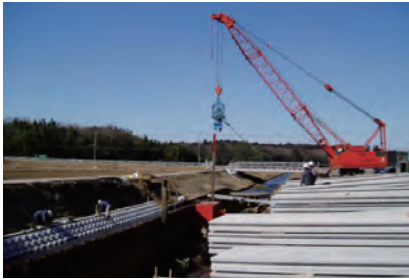
油圧パイプロ・ジェット併用工法