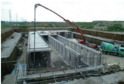
底板現場打ち部（コンクリート打設）