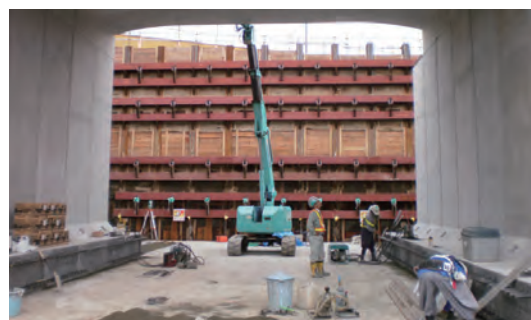
電動ウインチによる横引き工法