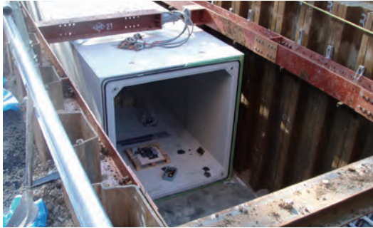
ボックスカルバート