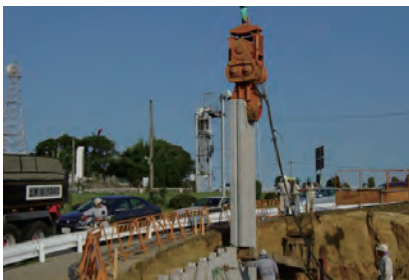
パイプロ・ジェット併用工法