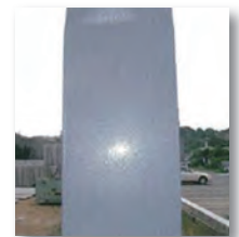
化粧カバー貼付け