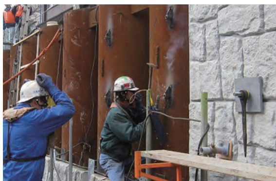
■ スタッド取り付け