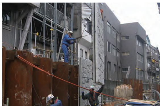
■ オールガードパネル取り付け