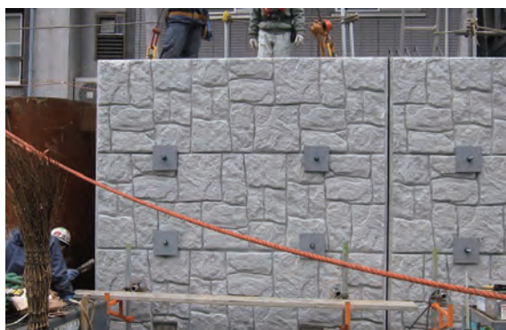
■ セパレーター取り付け