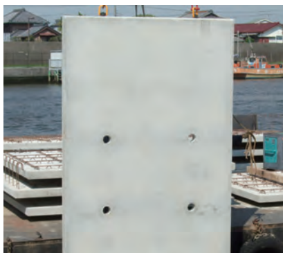
■ フラットタイプ（模様なし）