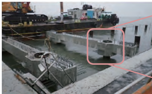
既設杭に受梁設置