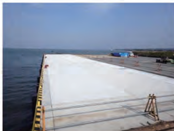
PCa 棧橋 施工後