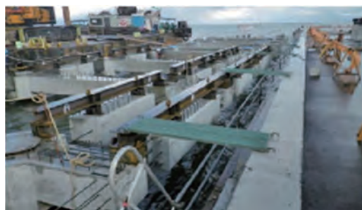
受梁同士の間にも中間梁設置