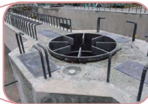
杭頭接続（二重管式）