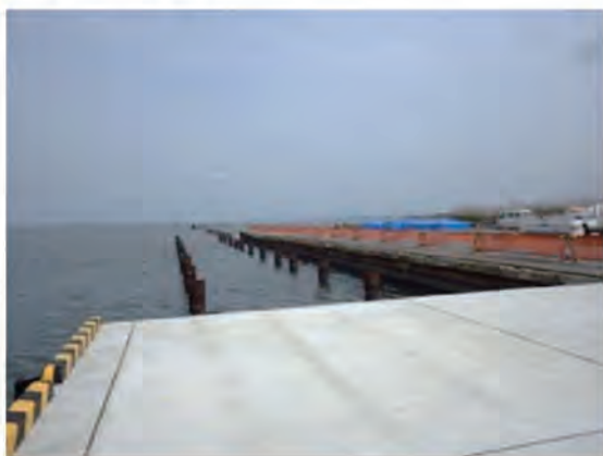
施工前（既設鋼管杭のみ）